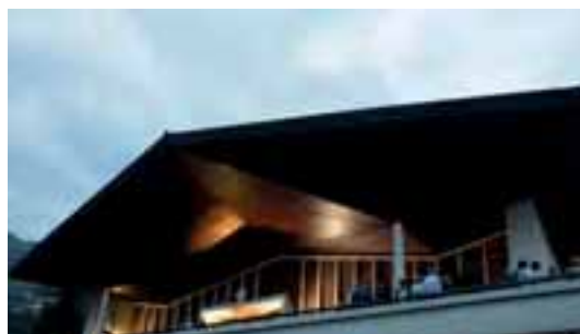
L'Église (500 places), avant un concert.