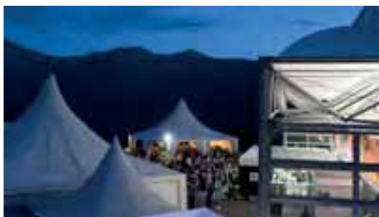
La Salle des Combins (1700 places) à la tombée du jour.