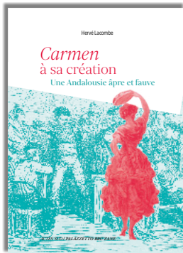
Carmen à sa création. Une Andalousie âpre et fauve. Hervé Lacombe

Due libri della collana Actes Sud / Palazzetto Bru Zane celebreranno il 150° anniversario della prima di Carmen in piena sintonia con questa stagione commemorativa. In “ Une Andalousie âpre et fauve. ” Carmen sur la scène de l’Opéra-Comique en 1875 , Hervé Lacombe ci rivela, con l’aiuto di numerose immagini d’epoca, l’universo visivo del primo allestimento di questo capolavoro, che da allora è stato rivisitato innumerevoli volte. Viceversa, Et Célestine Galli-Marié créa Carmen di Patrick Taïeb è un saggio biografico dedicato alla prima interprete del ruolo.